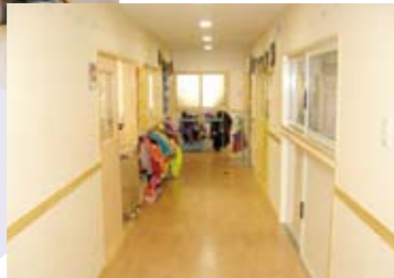
あたたかい雰囲気の園内