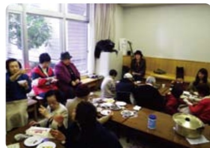
団らん室で和気あいあい