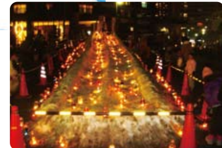
みんなで作って飾ったよ!!