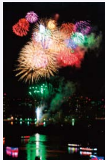
台場 にじ子さんの作品 「空の作品」