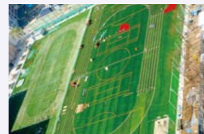
港南中OBさんの作品 「素晴らしい港南中グラウンド」