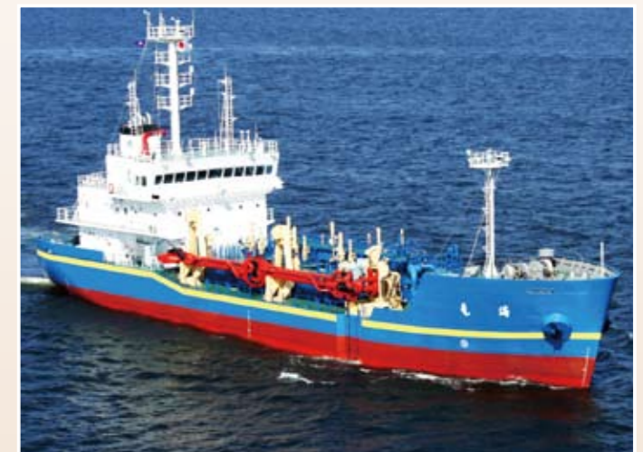
しゅんせつ船「海竜」