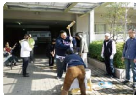
掛声に合わせて「よいしょ～！」

童謡コンサートでは、体を左右に揺らし、足でリズムをとる皆さんの姿が印象的で、アンコールが出るほど好評のうちに幕を閉じました。