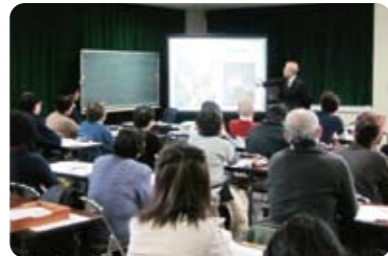
園芸だけでなく、歴史の勉強も