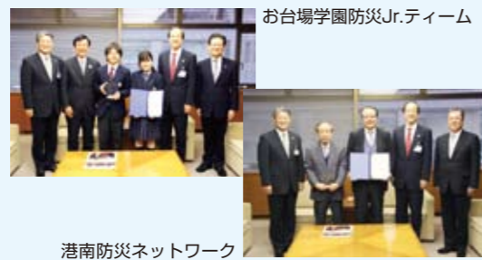
港南防災ネットワーク

港南防災ネットワークとお台場学園防災Jr.チームが、区長に地域の防火防災功労賞(主催:東京防災救急協会)受賞の報告を行いました。受賞した賞は、『防災救急協会理事長賞』という最優秀賞に次ぐ賞です。今回の受賞は、2009年の芝浦小地区防災協議会に続くもので、芝浦・海岸・港南、台場の3地区全てが受賞したことになります。