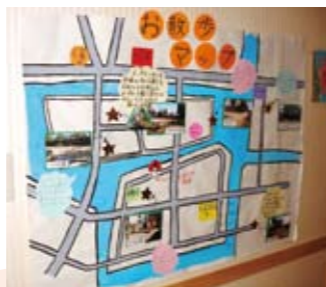
園庭で遊ぶかわりに地域をお散歩します