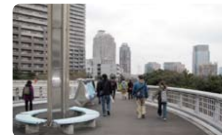
やっとお台場に到着