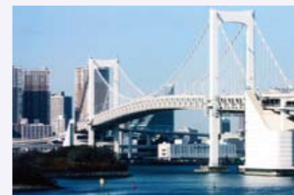
小坂 善男さんの作品 「早春のレインボーブリッジ」