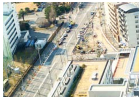
整備中の港南補助123号線

◎自転車の場合、スピード違反や駐車違反で切符をきられると罰金等はその場で確定します。自転車で違反切符を切られると車より大変な事をご存知ですか?錦糸町の東京簡易裁判所墨田庁舎内の警視庁交通部交通執行課墨田分室まで出頭することになるそうです。