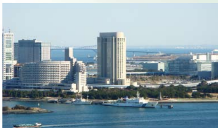
港南5丁目から台場をのぞむ

「水と緑、船運」それは、この地域が意図しているものです。その昔、週刊誌に東京砂漠と書かれ、緑が少なく土ぼこりが舞い、駅向こうの町と言われてから半世紀、今、日々インフラも整備され発展中の私たちのまち、技術革新によってその進展は速く、港南緑水公園、自転車専用レーンの完成も目前、品川・田町から台場へシャトルバスも走る。芝浦や水再生センター等にもオフィスビルができ、在勤者も居住者も増える。近い将来、駅には動く歩道もでき、港南5丁目か