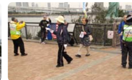
自由の女神前で記念写真