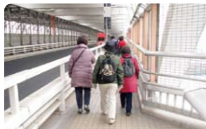
レインボーブリッジを歩く

レインボーブリッジは徒歩で渡ると30分弱、最後に北側の通路へ出ると、東京タワーとスカイツリーが一望できる素晴らしい眺めが待っていました。出発して約2時間、参加者は全員、満足感にあふれた顔で台場区民センターへゴールしました。