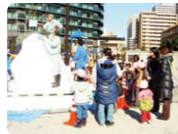
おんぶでここに親子