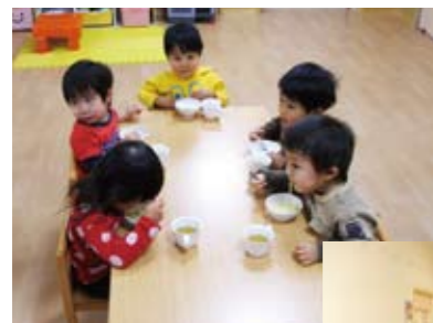
おやつは手作り おいしい～

自然な形で伸ばし「後伸びする力」を育むことを理念として掲げているとのこと。あたたかい木の風合いを生かした園内には子どもたちの楽しそうな笑顔が溢れ、おやつを美味しそうに食べている姿などが微笑ましい、アットホームな雰囲気の保育園でした。