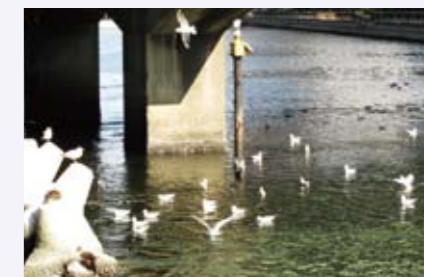
港南老生さんの作品 「新港南橋下の水鳥」

編集部では、表紙読者ギャラリーの作品[写真・俳句・イラストなど]を募集しています。