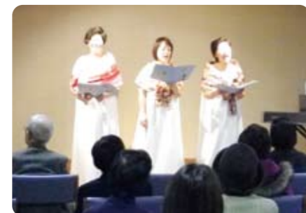
心温まる童謡コンサート