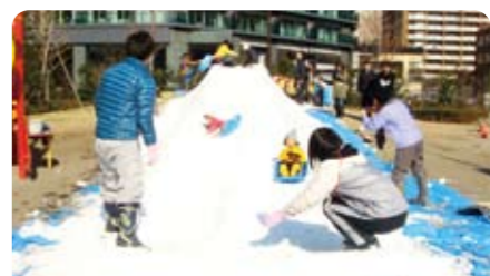
上手にスッテンコロリン

港南和楽公園に「雪やさんがきたー」と待ちかねた園児たちの歓声があがりました。今年の雪だるまはどんなの?と、園児や親子連れが待ちかね雪やさんもサポート隊も大忙し。2メートルほどの高さのすべり台は子ども目線だと、ちょっとしたバンジージャンプなみの勇気がいると思えるのに、転んでも泣く子はいませんでした。18日の手作り灯籠もカラフルで心いやされるものでした。幼少時の思い出づくりにも情操教育にも役立ち、次の世代にも引き継がれていく行事だと思いました。