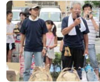
町会長、商店会長の挨拶