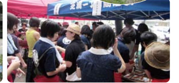
屋台にも人だかり