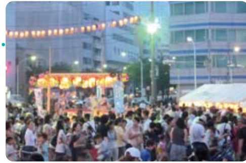
会場にはあふれんばかりの参加者