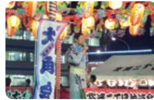
町会・商店会長のあいさつ