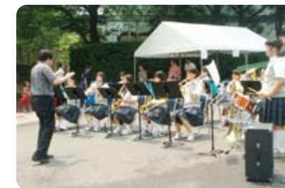
来年はテントの中で演奏できそうデス