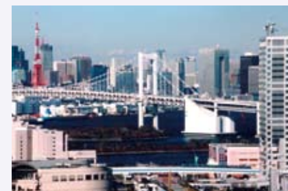
小坂 善男さんの作品 「レインボーブリッジのある風景」