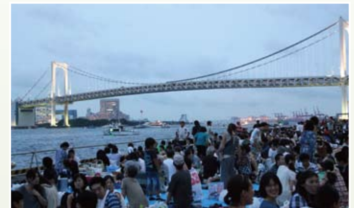
第24回東京湾大華火祭 芝浦ふ頭会場から