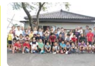
お世話になった、にかほ市の方々と

<事業概要> 平成22年は、我が国初の南極探検隊が芝浦の地(現埠頭公園)を出航して100周年でした。その南極探検隊を率いた白瀬 巖 隊長の出身地が、秋田県にかほ市(旧金浦町)です。港区芝浦港南地区と秋田県にかほ市は、南極探検隊出航100周年を契機に、子どもたちの交流を促進する事業を、平成22年度から行っています。