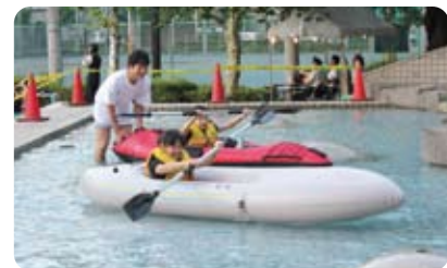
ワクワク楽しいカヌー体験