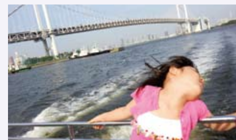
まんまるさんの作品 「東京湾の夏」