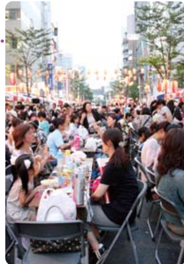
楽しい夏のひととき