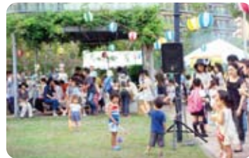
アチラコチラでシートを敷き交流の輪が