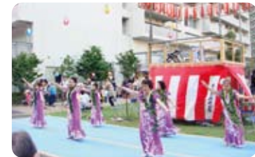
シニア世代のフラダンス