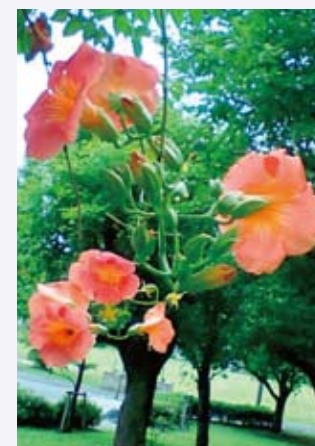
台場 にじさんの作品 「"かすら"とレインボー公園」