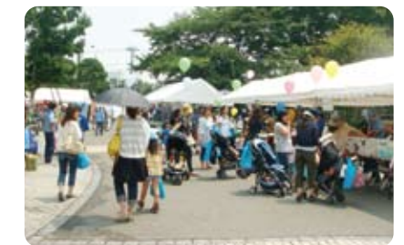
いつも親子連れでにぎわいマス