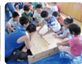
そば打ち体験、生地から作りました