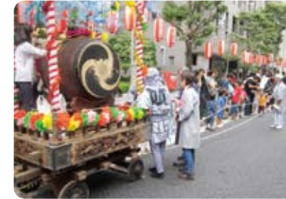
港南郵便局前から出発