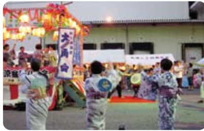
太鼓の響きにあわせての盆踊り

芝浦二丁目商店会主催、芝浦二丁目町会共催の納涼盆踊り大会が、7月14日・15日の2日間開催されました。今年も天気に恵まれ、子どもたちをはじめ大勢の人が集まり、会場である船路橋前を埋め尽くすほどの盛況ぶりでした。太鼓の演技が披露されるとともに、盆踊りは大いに盛り上がり、にぎやかなお祭りとなりました。