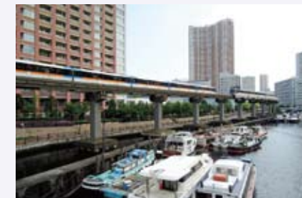
多和 裕二さんの作品 「芝浦運河とモノレール」