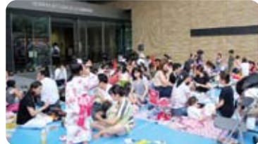
芝浦工業大学前にて