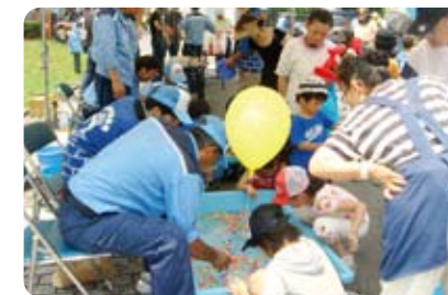
どれがいいかなー

る楽曲を披露し人気を集めていました。子どもは金魚やカラフルなボールすくい、大人は花鉢などのお土産を手に、樹木の日陰で涼んでいました。建設中の商業ビルが完成する来年のサマーフェスタが楽しみです。