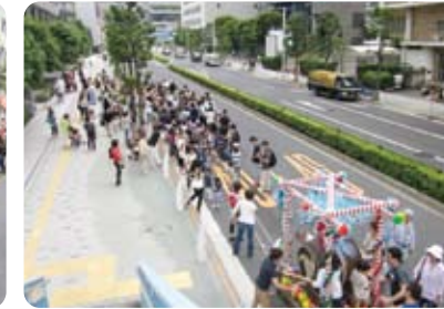
駅前の気持ちの良い通りを進む