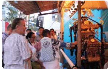
外国人観光客はお神輿に興味津々

住人はもちろん近隣で働くサラリーマンやOLも加わって、真っ直ぐ歩くのが難しいほどの盛況ぶりに、芝浦三・四丁目エリアの町としての成熟を感じました。