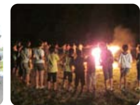
地元の子とキャンプファイヤー