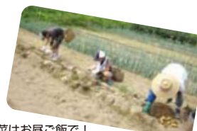
収穫した野菜はお昼ご飯!

参加した子どもたちは、普段見ることのできない満天の星空や豊かな自然に感激!「また来年も行きたい」といった声も多く、充実した3日間になったようでした。