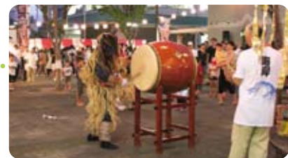
迫力満点のなまはげ