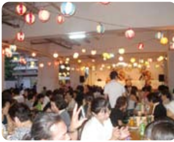
ちょうちんの下には座席がたくさん