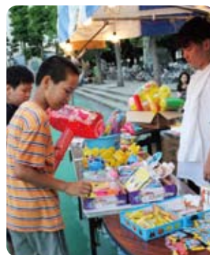
射的などの景品も豪華!

今年も秋田県からは、なまはげが登場。「悪い子はいねが～」の声に泣き叫ぶ子も。泣いたり笑ったり、大いに夏の1日を満喫する子どもたちでした。