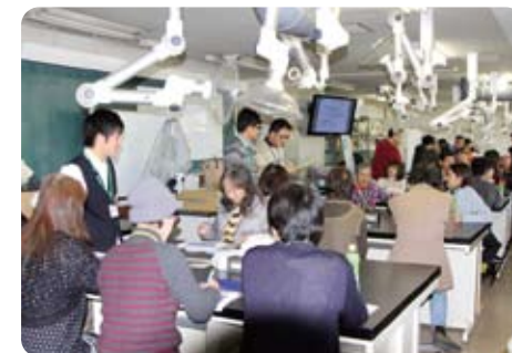
東京海洋大学の実験室で講義開始!