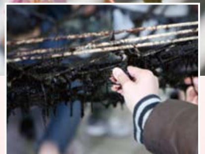
お台場ふるさとの海づくり事業 海苔づくりの様子