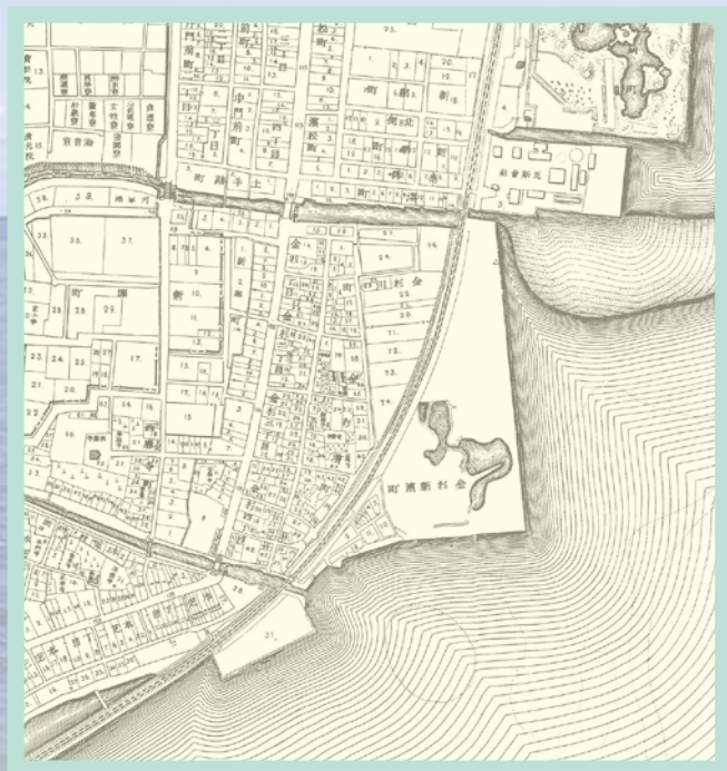
明治時代の地図(『増補港区近代沿革図集』)