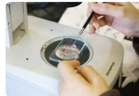
マハゼの透明骨格標本を解剖!

最終日には「△年後の江戸前の海の姿を考えよう」というワークショップを行いました。参加者の意見の一部を紹介します。