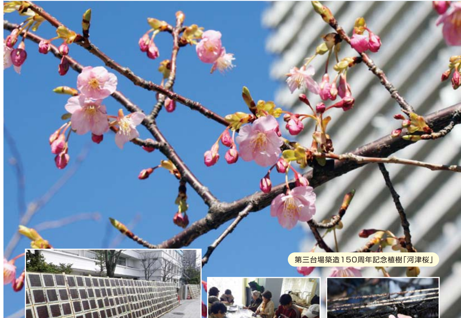
第三台場築造150周年記念植樹「河津桜」