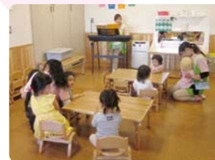
朝のおあつまりの時間