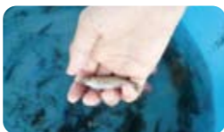
近くですくって見てみよう