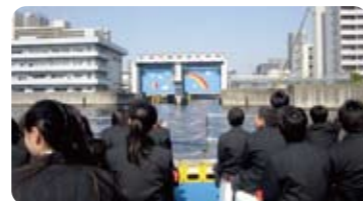
間近で見ると高浜水門