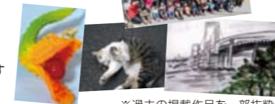
※過去の掲載作品を一部抜粋

芝浦港南地区の人、暮らしを伝える作品をお送りください。応募方法は、作品にタイトルを添えて、住所・氏名・電話番号・作品の返却希望の有無・匿名またはペンネーム使用希望の有無を明記の上、べいあつ編集部までお送りください。写真はデータでもプリントでもOKです。携帯写真でも大歓迎です。読者のあなたが「べいあつ」を盛り上げてください。