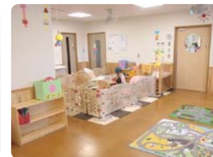
きれいで広々としたスペース