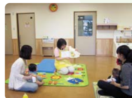
大人も聞き入ってしまうほどの読み聞かせでした

〒108-0075 東京都港区港南4-2-4 都営住宅1F TEL:03-5796-8862