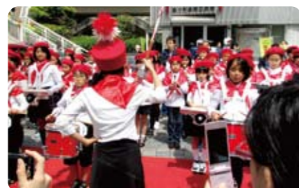
港南小学校の鼓笛隊