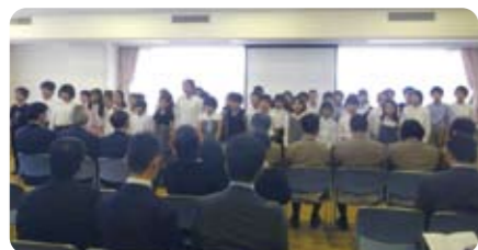
お台場学園児童による合唱

式典では、お台場学園の5年生のみなさんが、「感謝のうた」を合唱し、関係者から感謝状や記念品の贈呈をするなど、終始和やかな雰囲気で行われました。お台場と田町・品川間の移動時は、是非利用しましょう。