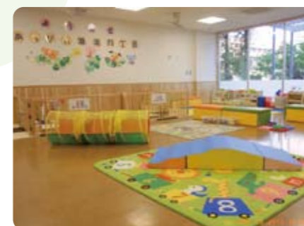
カラフルな玩具がたくさん