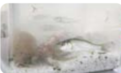
お台場の海の魚を観察