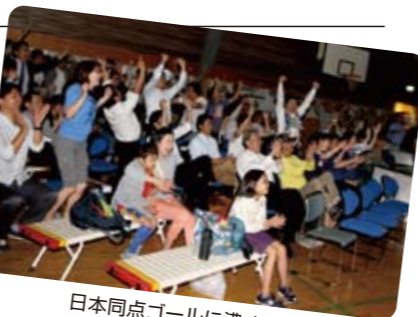
日本同点ゴールに沸く会場