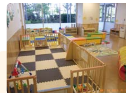
保育サポートの帰りに利用される方も