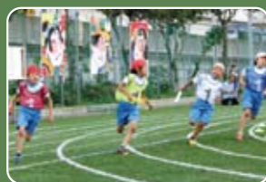
6月8日(土) 運動会の様子