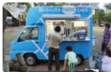
芝浦商店会チャンネルカフェが臨時出店

結果はご承知の通り、1対1のドロー。でも、終了3分前、日本のエース本田選手の見事なPKに皆満足、気持ち良く家路につきました。