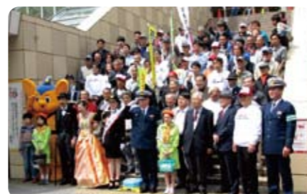
高輪警察署長を囲んでクラシックカーのオーナーの皆さん