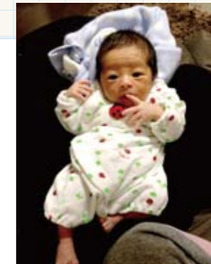
あさみさんの作品 「京(けい)誕生」