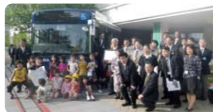
みなさんではいっす