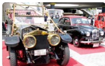
パレードの先頭に立つクラシックカー