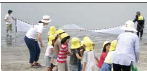
地引網を引きます

目の前に広がるお台場の海にも、たくさんの生物が棲んでいます。子どもたちもふるさとの海について考えるいい機会となりました。