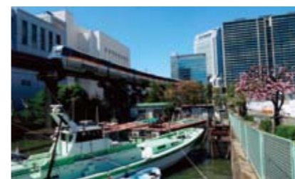
泥谷 隆史さんの作品 「モノレールと船と桜」