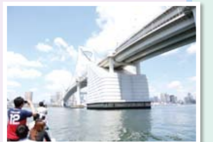
5月12日の船での地域めぐりの様子

5月12日には、地域を知るとともに、メンバー同士の交流を目的として地域めぐりを実施しました。