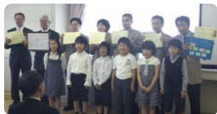
いつもありがとう