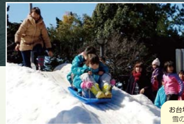
お台場雪まつり 雪の滑り台を 楽しむ子どもたち