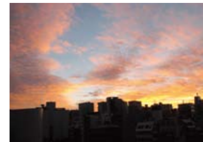
港南 老生さんの作品 「ビル街の朝焼け雲」