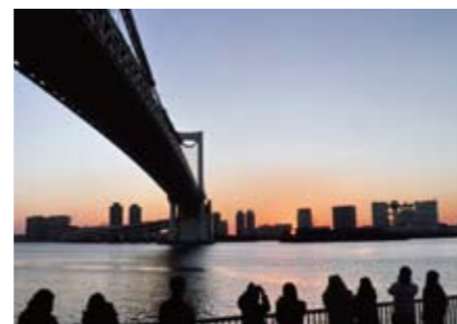
永見 義夫さんの作品 「海からの初日の出(芝浦南ふ頭公園)」