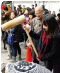
12月8日 芝浦一丁目町会 もちつき