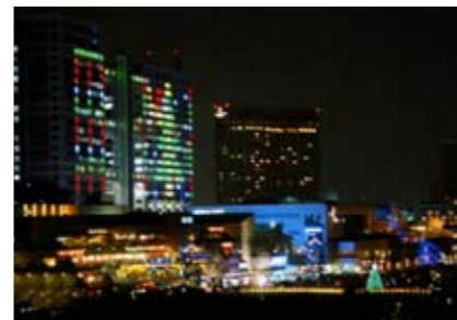
台場 にじ子さんの作品 「台場の街とイルミネーション」