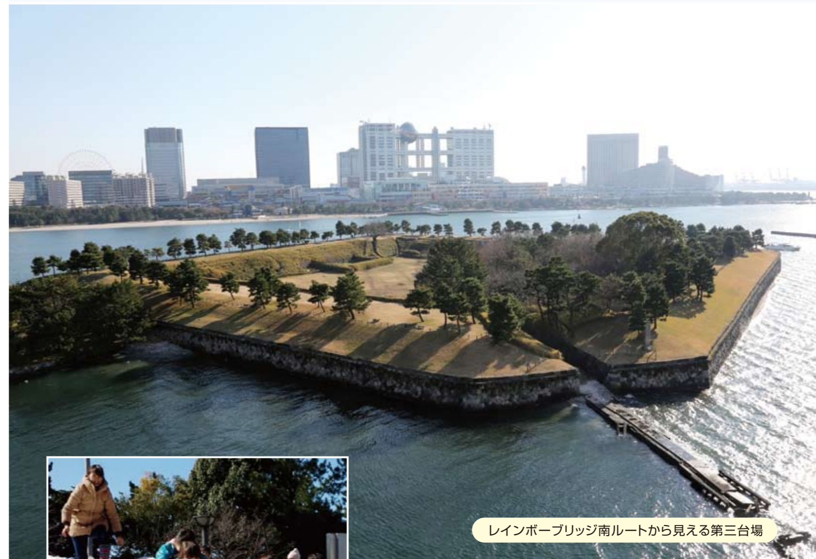
レインボーブリッジ南ルートから見える第三台場