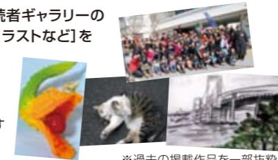
※過去の掲載作品を一部抜粋

芝浦港南地区の人、暮らしを伝える作品をお送りください。応募方法は、作品にタイトルを添えて、住所・氏名・電話番号・作品の返却希望の有無・匿名またはペンネーム使用希望の有無を明記の上、べいあつ編集部までお送りください。写真はデータでもプリントでもOKです。携帯写真でも大歓迎です。読者のあなたが「べいあつ」を盛り上げてください。