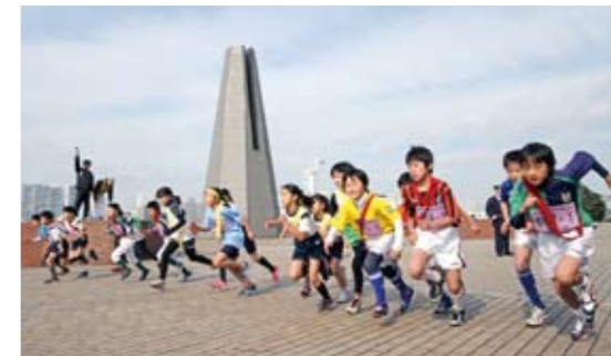
多和 裕二さんの作品 「第6回お台場駅伝競走大会」