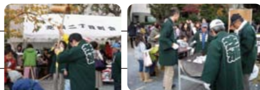
12月1日 芝浦二丁目商店会 謝恩もちつき大会