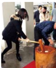
1月12日 港南四丁目 第3アパート自治会 もちつき