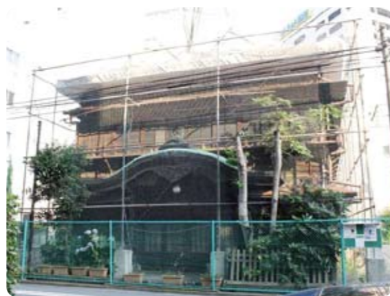
旧協働会館の正面

戦後は東京都により港湾労働者の宿泊所として転用されましたが、芝浦の歴史や文化を今に伝える貴重な財産として、平成21年に港区に建物が譲渡され、港区指定有形文化財に指定されています。区では、伝統文化の継承や地域活動、交流拠点として、旧協働会館を利用するため、平成26年度に整備計画を策定します。