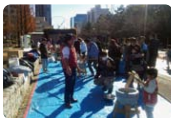
12月28日 台場一丁目自治会連合会 もちつき