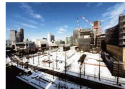
泥谷 隆史さんの作品 「雪の朝」