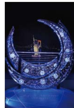
八島 雅之さんの作品 「ブルームーン」