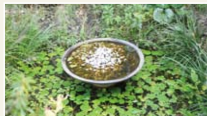
エコプラザビオトープ

大人も子どもも、お勤めの方も、興味のある内容に参加して、港区の環境を再発見し、エコについて考えてみませんか。