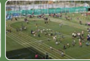
げんきアップタイムでは元気いっぱい体を動かします。