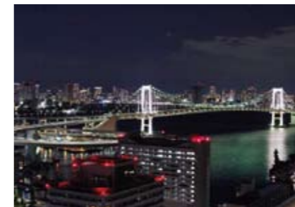
角 明洋さんの作品 「大雪去り、空気の澄んだ東京」