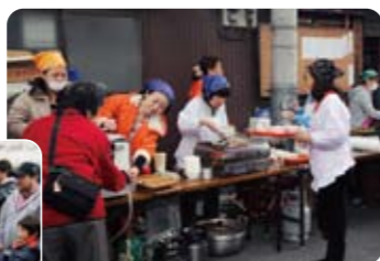
12月23日 海岸二・三丁目町会 もちつき