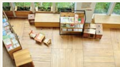
1階多目的スペース