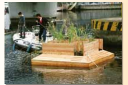
新たな人工巣の設置作業中