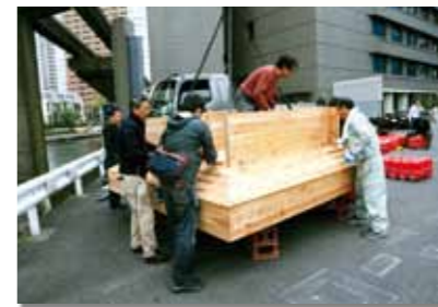
組み立て中の新たな人工巣