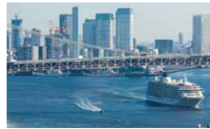
澤田 智成さんの作品 「晴海から出航した豪華客船」