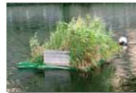
平成19年に設置した最初の人工巣

芝浦西運河において、平成19年に設置した最初のカルガモ人工巣が老朽化により倒壊の恐れがあるため、11月11日(火)、新たな人工巣と交換を行いました。