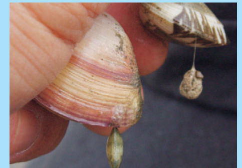
砂中から取り上げたシオフキ貝にぶら下がるアサリの稚貝。右側は砂中の石ころに糸を張っていたアサリです。