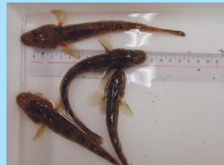
全長14.3~17.8cmの大型のマハゼが網に入りました。