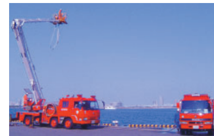
空中作業車放水訓練

その他、災害時にお年寄りや体の不自由な方が避難するのを助けたりする「消防のふれあいネットワーク」づくりを、町会・自治会の皆さんに呼びかけています。ご協力をお願いします。