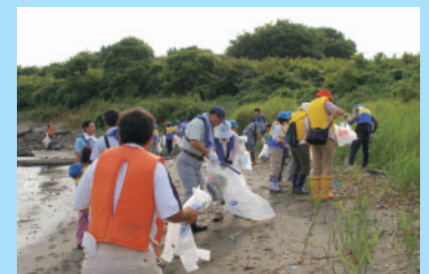
すっかりきれいになりました(^ ^)

せっかくの手つかずの自然が残っている鳥の島ですが、どこかで捨てられたゴミが漂着して、島を汚してしまうのは残念なこと。私達がゴミをむやみに捨てないことで、身近にある貴重な自然は、まだまだ守られると感じました。