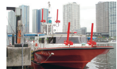
最新鋭消防艇「かちどき」

また、2艇の最新鋭の消防艇が配備され、船舶火災や運河沿いの建物火災の消火活動をはじめ、様々な水難事故に対応して東京湾から江戸川、荒川などにも出動しています。