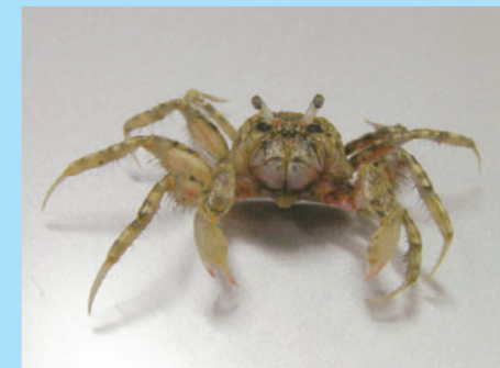
干潟の小ガニ……コメツキガニ