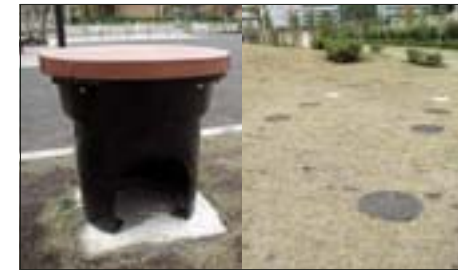
港南和楽公園 マンホール型トイレ・かまどベンチなど、防災機能も備えています。