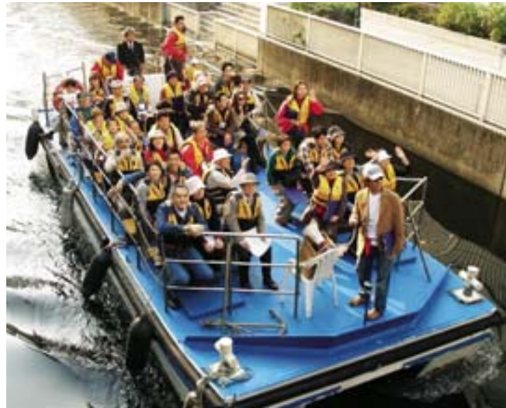
ひと時の船旅に出発です

区政60周年記念事業の第1弾として11月3日に、港区ベイエリア・パワーアッププロジェクト／第1分科会主催による、運河めぐりが行われ、89名の参加者は3班に分かれ、JR田町駅近くの新芝橋からひと時の船旅、運河めぐりに出発。香取橋、竹芝橋をめぐり芝浦運河に出たところで南下し、建設中の芝浦アイランド付近では、生物が生息しやすいように工夫された護岸の説明を受け、その横をカルガモの親子がのんびり泳ぐ姿に心なごみました。浜路橋先の水再生センターを通り過ぎ、御橋橋付近で美しく整備された護岸を見ていると潮の香りを感じるようになり、心地良い潮風を感じながら天王洲水門をめぐり京浜運河へ。品川埠頭の東京水上警察署、高輪消防署港南出張所を通り過ぎると視界は一気に開け、レインボーブリッジ越しに水面の高さから見るお台場も、一層美しく感じました。