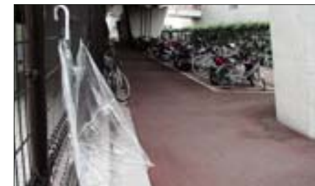
お台場海浜公園駅周辺 台場地区での放置自転車やゴミの問題、休日に利用できる医療施設がない、などの問題について説明がありました。