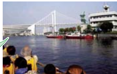
高輪消防署港南出張所に停泊中の消防艇