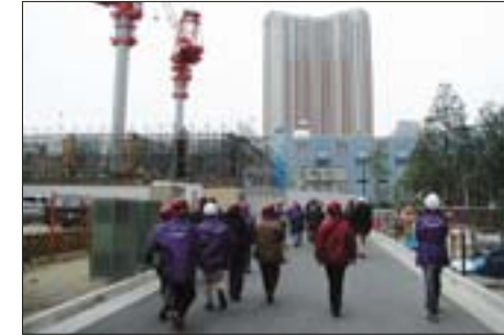
芝浦アイランド 医療施設や商業施設、遊歩道が整備され、あらゆる世代が交流できるコミュニティの形成が期待されています。