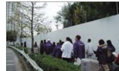
港南4丁目税関住宅等跡地 幼稚園・小学校の建替えや、道路の線形変更が計画されています。