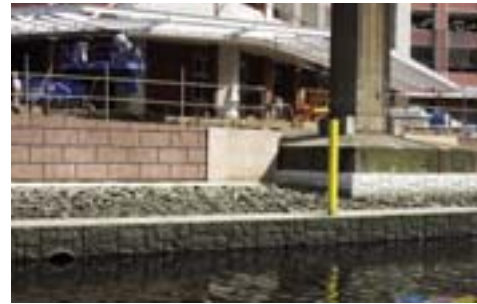
生物に配慮して作られた護岸

運河めぐり終了後の芝浦港南地区総合支所でのティータイムでは、運河めぐりで感じたことなどを大きな地図に書き込みながら、身近に楽しめる運河の魅力等について語り合いました。