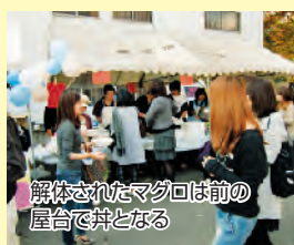
解体されたマグロは前の屋台で丼となる