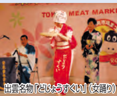
出雲名物「どじょうすくい」(女踊り)