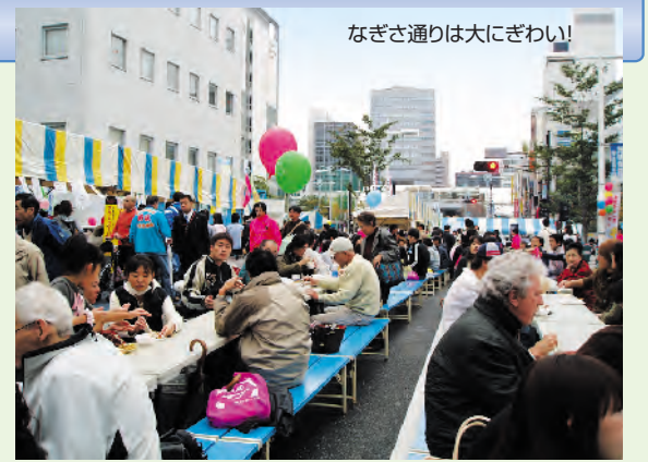
なぎさ通りは大にぎわい!

また、今回も使い捨ての食器は使わずに、学校給食で使用された食器(リユース食器)が採用され環境に配慮したおまつりをPRしました。