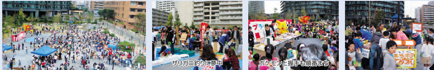
ザリガニ釣りに夢中