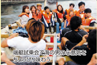
端艇試乗会で海の男の心意気をちよっぴり味わう