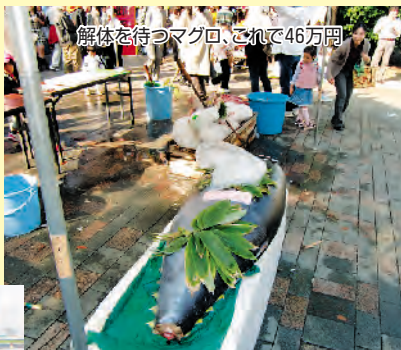
解体を待つマグロ、これで46万円

好天に恵まれたキャンパスには例年にも増して多くの方が訪れました。展示や講座には親子連れも含め参加者が多く、分かりやすい解説で各講座は満席でした。また、恒例となった「マグロの解体」→「マグロ漬どんぶり」をはじめ、多くの屋台や売店は学生、保護者、地元の方々で大にぎわい。会場全体に魚介類を料理する煙やにおいが立ち込め、海洋大学らしい雰囲気を感じました。