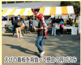
えびの看板を背負って懸命の呼び込み