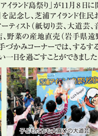
子どもたちも大喜びの大道芸