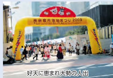
好天に恵まれ大勢の人出