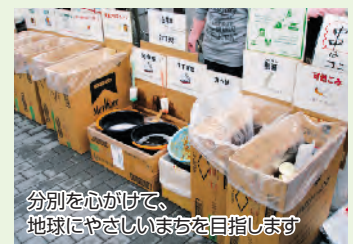
分別を心がけて、地球にやさしいまちを目指します