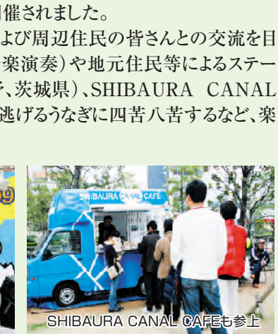
SHIBAURA CANAL CAFEも参上