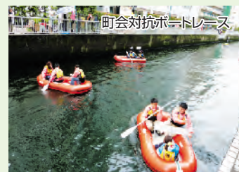
町会対抗ボートレース