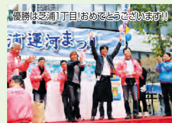
優勝は芝浦1丁目!おめでとうございませう!!