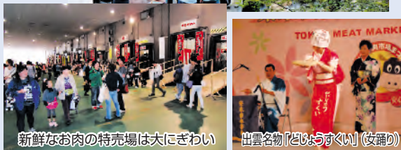
新鮮なお肉の特売場は大にぎわい