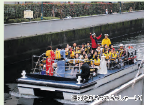
運河巡りいってらっしゃーい!

10月25日、芝浦運河まつりが開催され、なぎさ通りを中心にたくさんの人でにぎわいました。この日はさまざまな店が出ていたほか、フリーマーケット、運河巡り、運河クルーズが行われました。また、町会対抗ボートレースでは、ままならない操船にたくさんの声援で盛り上がりを見せていました。