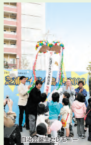
自治会誕生セレモニー

アイランドフェスタ改め、「芝浦アイランド島祭り」が11月8日に開催されました。「芝浦アイランド自治会発足」を記念し、芝浦アイランド住民および周辺住民の皆さんとの交流を目的として行われました。ヘブンアーティスト(紙切り芸、大道芸、音楽演奏)や地元住民等によるステージショー、住民有志による模擬店、野菜の産地直売(岩手県遠野、茨城県)、SHIBAURA CANAL CAFE等の出店ほか、うなぎの手づかみコーナーでは、するする逃げるうなぎに四苦八苦するなど、楽しい催しが盛りだくさんで、楽しい一日を過ごすことができました。