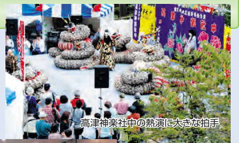
高津神社社中の熱演に大きな拍手

使ったしゃぶしゃぶをはじめ島根県の特産品を目指してたくさんの方が集まりました。舞台では島根名物「どじょうすくい」踊りやヤマタノオロチ伝説にちなんだお神楽が披露され、観客の拍手を浴びました。隣の「品川インターシティ」恒例の週末フリーマーケットも活況を呈しました。