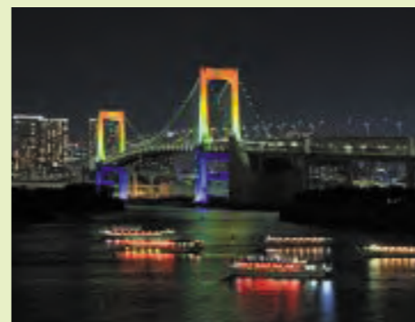
多和裕二さんの作品 「お台場冬景色」