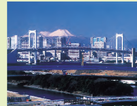
小坂善男さんの作品 「レインボーブリッジと富士山」