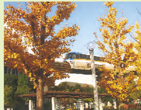
泥谷隆史さんの作品 「黄葉の頃」