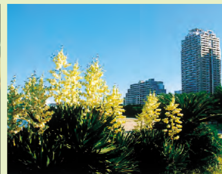
台場にじ子さんの作品 「台場海浜に咲くユッケ」