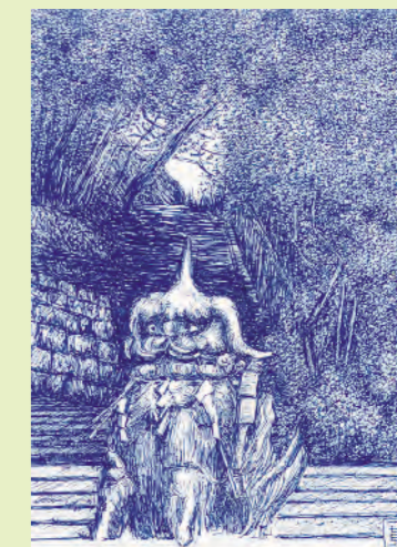
藤森寛二さんの作品 「神社の風景」