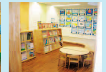
木をふんだんに使った読書コーナー