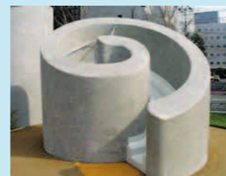
うずまき型の滑り台