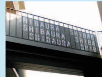
「SHIBAURA」とデザインされた渡り廊下

冬が終わり、季節はもう春。夢いっぱい校舎で新学期を迎える子どもたちには、大きな夢をもち元気に育って欲しいですね!