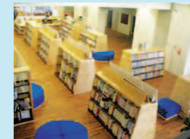
開放的な図書スペース