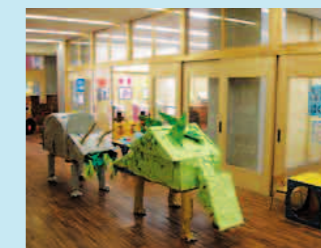
温かみを感じさせる木の素材を生かした園舎