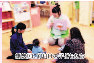
紙芝居に釘付けの子どもたち