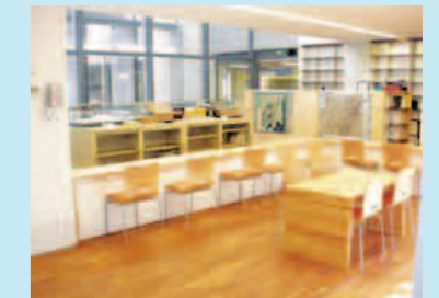
4階ラーニングセンター(芝浦資料室)