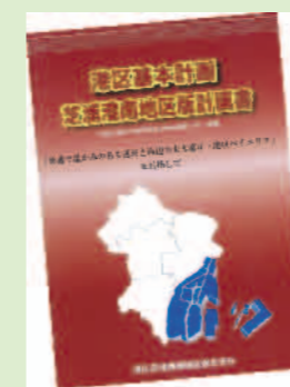
芝浦港南地区版計画書

このプロジェクトでは、地区版計画の計画期間（6年間）の後期3年間（平成24年～26年度）の見直しに向け、計画の進捗状況の確認や地域の課題、地域事業の検討を行い、平成23年度に検討結果を「提言」として区に提出することを目的として活動を行います。