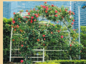
笠松信二郎さんの作品 「芝浦中央公園運動場のバラ」