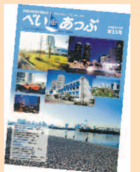
平成22年3月発行のべいあつぷ第15号