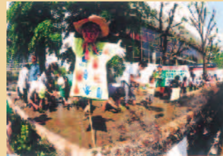
泥谷隆史さんの作品 「都心で田植え」