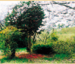
台場にじ子さん 「台場の桜と椿」