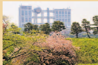
多和裕一さんの作品 「お台場の春」