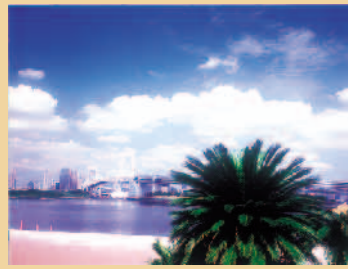
小坂善男さんの作品 「お台場夏色」