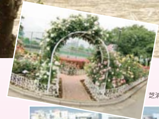
芝浦中央公園のバラ