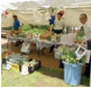
新鮮な野菜や果物の産直