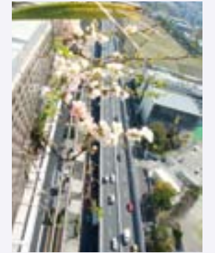
港南かるがもさんの作品 「ベランダから飛び出したボケ」