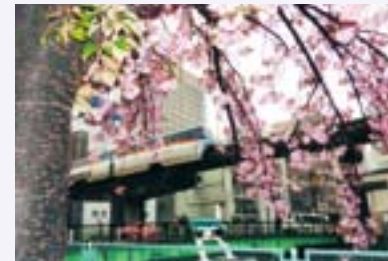
泥谷隆史さんの作品 「春たけなわ」