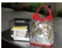
復興への願いを込めて