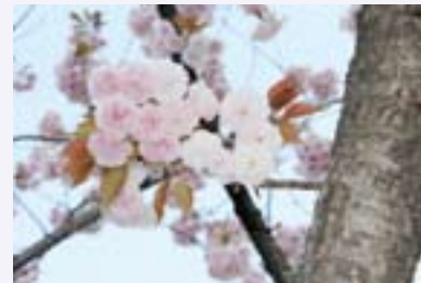
かとちゃんさんの作品 「田町駅前八重桜」