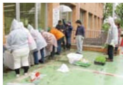
今年も雨の中の作業でした