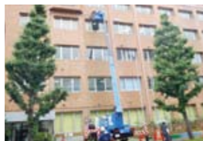
5月30日ネットを取り付けました