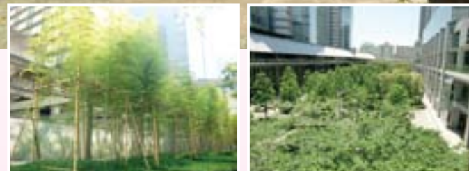
左 Wビル、右 品川セントラルガーデン