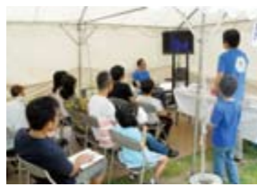
自治会役員による防災DVD上映&質疑応答

両手でも持てないくらい重い義援金を自宅から持ってきた5歳の女の子もいました。イベントの中盤以降に風雨が強くなり中止になりましたが、今回のイベントの実施は、住民の防災への意識作りのきっかけとして意義のあるものとなりました。