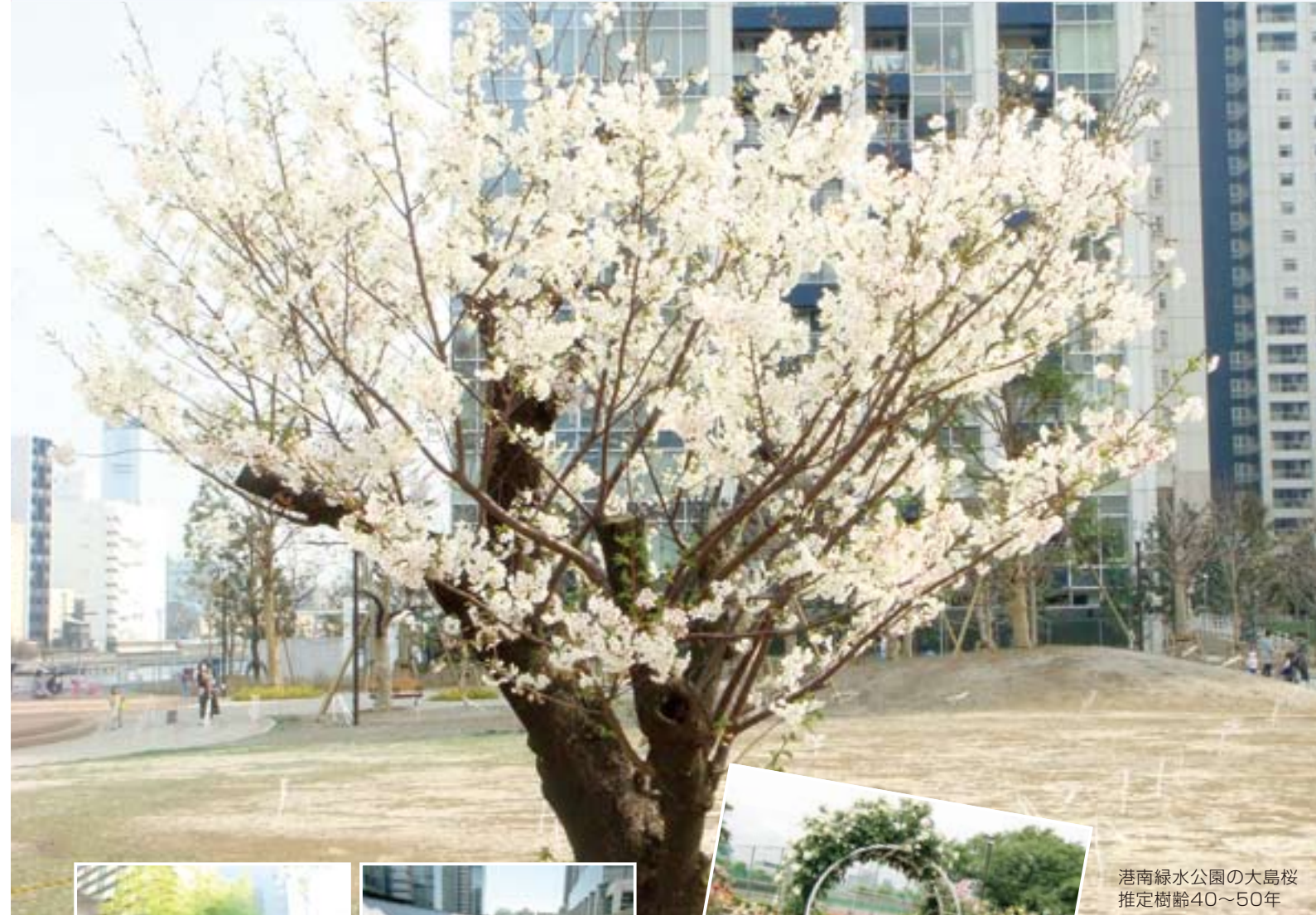
港南緑水公園の大島桜 推定樹齢40~50年