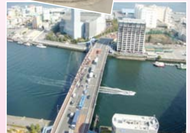
京浜運河にかかる港南大橋 上空から