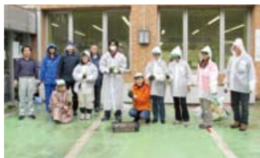
5月11日私たちが植えました