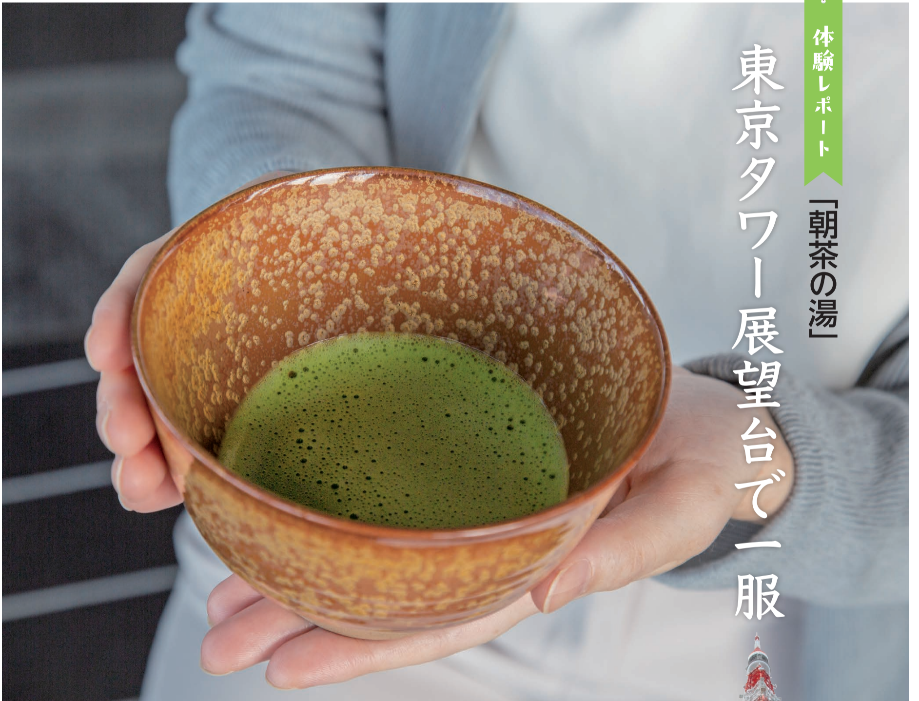
全国各地の焼き物で いただくお抹茶