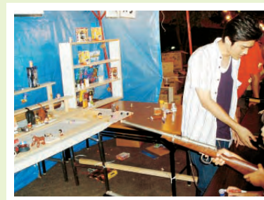
芝ちびっ子まつりでの様子

翔ジュニア』もその役割を果たしています。今年で2年目になる芝翔ジュニアは、有志の1・2年生で構成されています。生徒は、その日に割り当てられたお店の手伝いをします。今回は、芝商店会の芝ちびっ子まつりの様子をお届けします。学校からさほど遠くないところで行われたこのイベントでは、ゲームや飲食物のお店等で活動しました。ゲームは、つりや射的等のお手伝いです。たくさんのお子もたちが遊びに来てくれました。