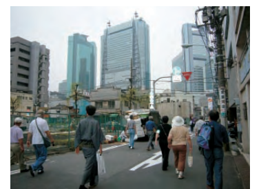
施設見学会の様子。歩いて芝地区を巡りました

8月には、テーマごとに部会を作って活動開始。芝地区をより良く住みやすくするために、話し合い、行動していきます。これからどんな展開になっていくのか。「芝会議」の今後に期待してください！