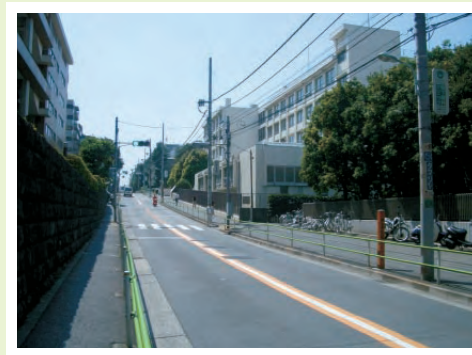
綱の手引坂と三田高校（右奥の建物）

三田高校の校舎は、昭和50年の建て替えの際に、坂側に校舎を建てたため、東館と西館で校舎の高さが半階違う構造になっています。現役三田高校の生徒に坂について