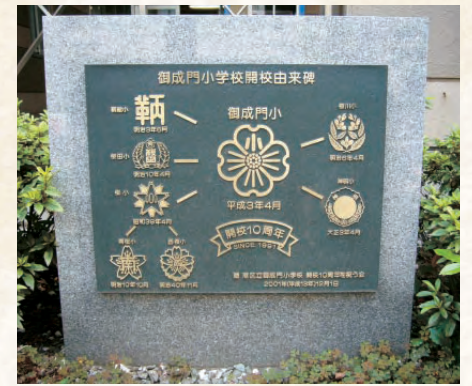
御成門小学校の開校由来碑（御成門小の正門前にあります）。それぞれの小学校が集まって御成門小となったことを表しています。左上が鞆絵小です

『愛宕・西ノ久保の歴史を掘じくる会』という会があります。メンバーは鞆絵小学校同窓会「鞆絵会」の面々。それぞれの生まれ育った地区について、また、地区に限らず江戸時代の生活等々、現在につながる歴史や暮らしについて月に1回程度集まり勉強会を開いているのです。その中から芝地区にまつわる話を紹介します。