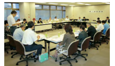
第1回芝会議。毎回、活発な意見が飛び交っています