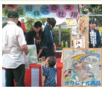
芝浦まつりでの芝翔の販売の様子と「みなと虹色飴」

仕入先との交渉なども生徒自身が行っています。仕入れから販売までを生徒自身が行うことで、仕組みや楽しさ、難しさを知り、次なる飛躍への第一歩としています。