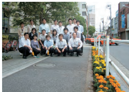
作業を終えて、満足気な表情の社員の皆さん

去る6月5日の昼下がり、芝公園2丁目芝公園保育園近くの通りに、突然、20人の集団が現れました。手には軍手とシャベル…その集団が立ち去った後には、色鮮やかな花が咲きました。この心やさしき集団、実は、アドプト活動に参加されているシャープ株式会社浜松町事業所の皆さんでした。「植栽に初めてチャレンジしました。植栽の作業は思った以上に楽しく、作業を終えた歩道を見るとまちが華やかになり参加者一同ですがすがしい気分になりました」と、代表の方