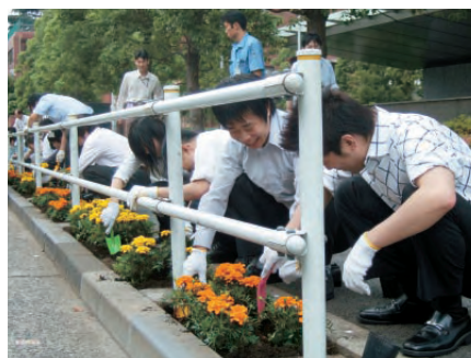
シャベルを手に、マリーゴールドを植えます