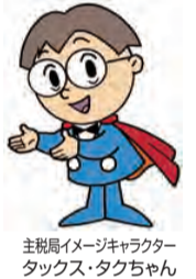
主税局イメージキャラクター タックス・タクちゃん

なお、複数の都税事務所より課税されている場合でも、一つの都税事務所等に申請していただくことで、納税義務者にかかるすべての都税についての証明を行います。