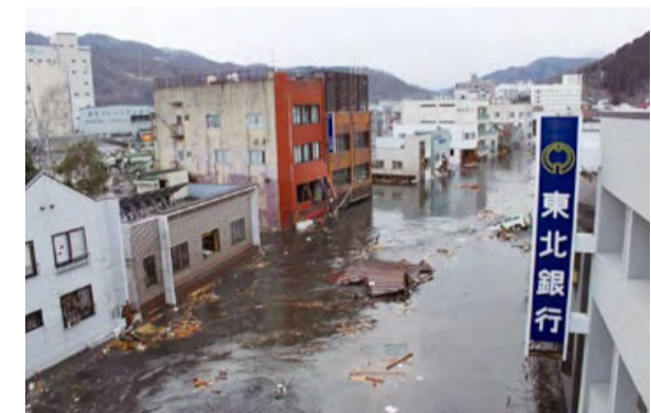
釜石市中心部の地震直後の様子。天津さんのご自宅も写っている