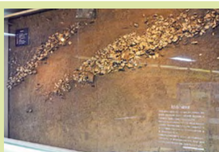
貝塚の断面