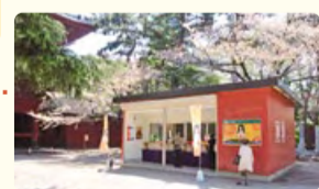
増上寺の境内にある「臨時観光インフォメーションコーナー」