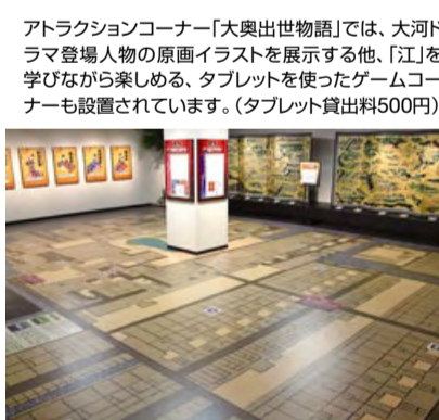
アトラクションコーナー「大奥出世物語」では、大河ドラマ登場人物の原画イラストを展示する他、「江」を学びながら楽しめる、タブレットを使ったゲームコーナーも設置されています。(タブレット貸出料500円)