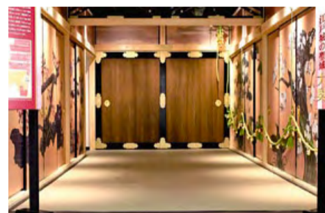
再現された御鈴廊下(おすずろうか)。大奥と中奥はこの廊下で結ばれており、ここを通れる男性は、もちろん将軍ただ一人でした