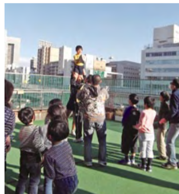
屋上ではスローインのときの「リフトアップ」も体験しました。その高さに子どもたちはビックリ!