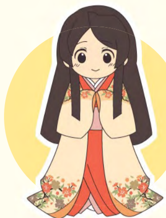
江姫(こうひめ) ～港区観光協会歴史観光 イメージキャラクター～