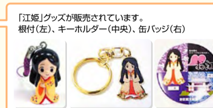
「江姫」グッズが販売されています。根付(左)、キーホルダー(中央)、缶バッジ(右)

港区観光協会 http://www.minato-kanko.com/ 芝公園4-2-8 東京タワー地下1F TEL 03-3433-7355 (10時～16時/土日祝除く)