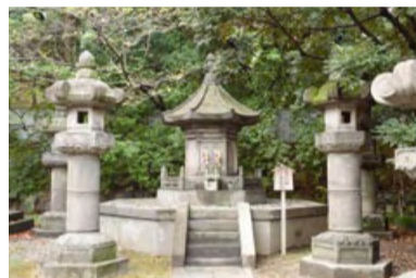
徳川霊廟・秀忠のお墓