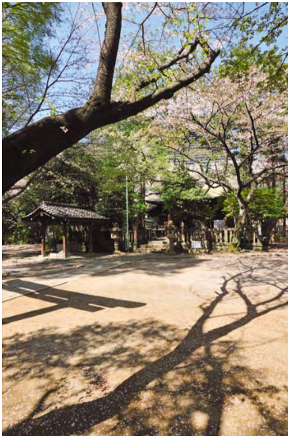
NHK大河ドラマ「江～姫たちの戦国～」のお江(崇源院)は、徳川家康と秀忠が関ヶ原の戦いに臨むに際し、同神社を参拝し、その戦勝と心身の安全を祈願しています(写真は西久保八幡神社の境内/4ページに関連記事)

『芝地区地域情報誌』は、地域の皆さんとともに創る情報誌です。芝地区の「いい話」を紹介したり、様々な行事や活動の情報を交換したり、地域の皆さんと一緒に地域のことを考えていく場として、地域情報誌を発行しています。