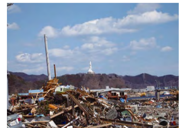
釜石市湾漁業協同組合のあった平田地区。中央に見えるのは釜石大観音