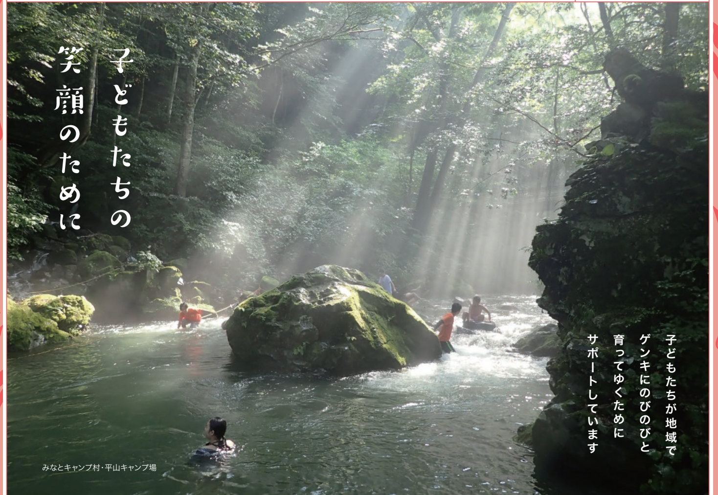
みなとキャンプ村・平山キャンプ場