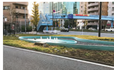
魚らん坂下緑地噴水