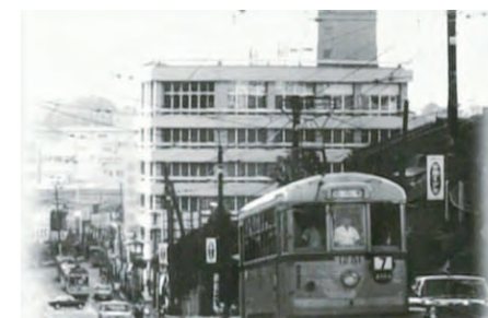
昭和繁栄期の頃の様子

雪が降った時などは、沿線の中でも急な坂と言われていた伊皿子坂(頂上で魚らん坂に繋がる)を電車が登れない事などもあり、線路に砂を撒き摩擦を多くして、なんとか急な坂を登っていました。