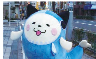
マスコットキャラクター「ぎよらにゃん」 ©服部圭郎