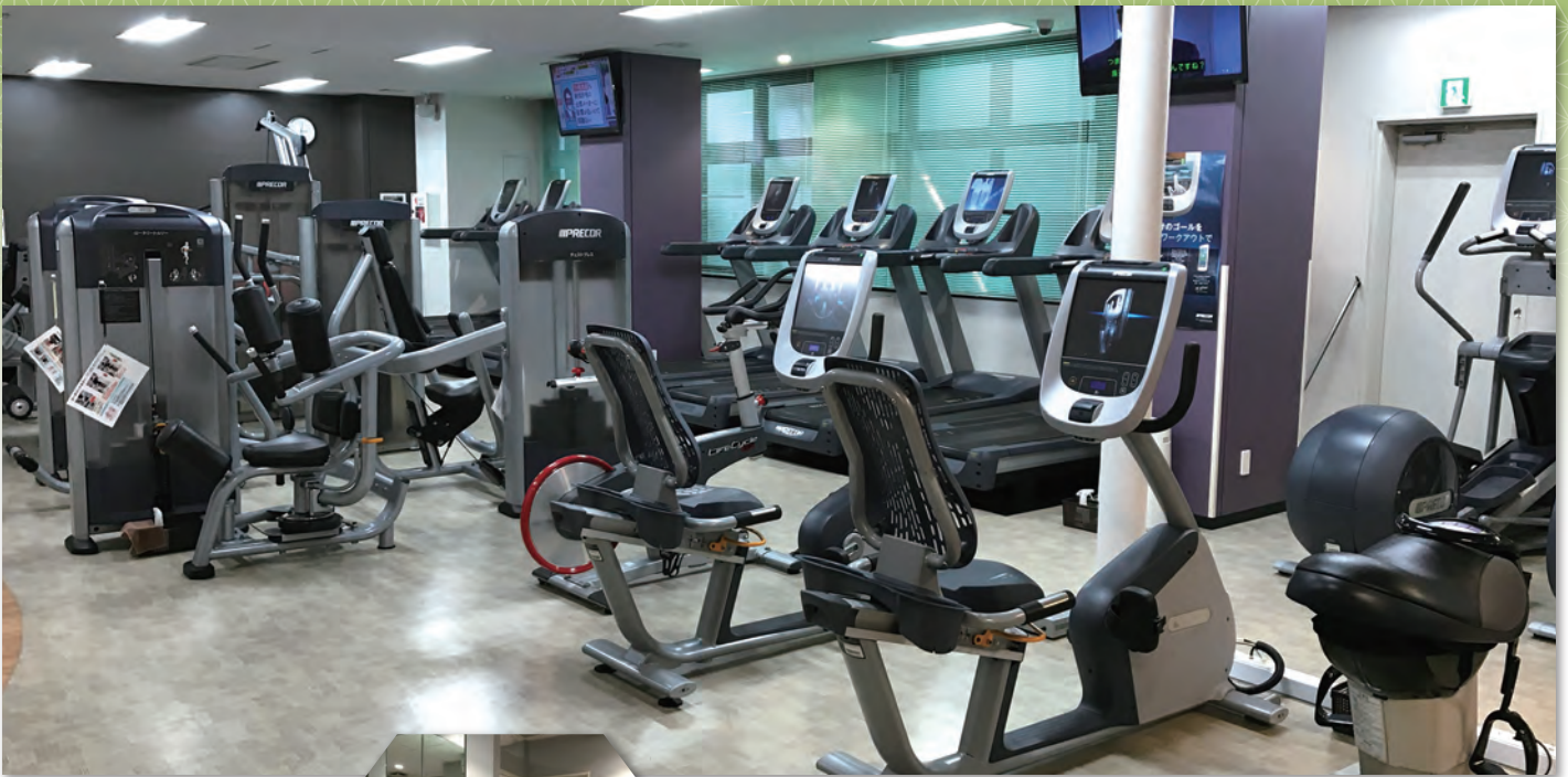
仕事場や旅行先の近くでも通うことができる