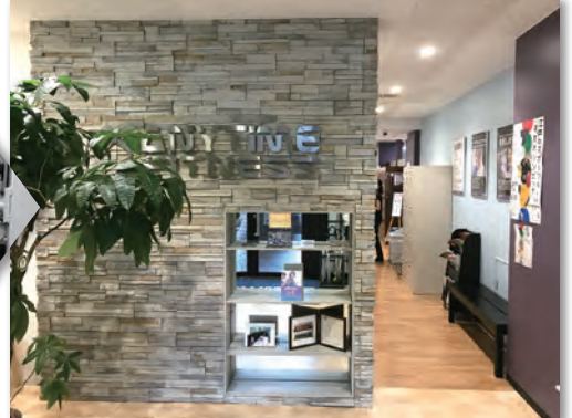
個室のシャワー室など設備も充実