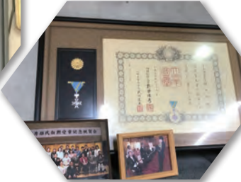
店内に飾られている瑞宝章の勲章