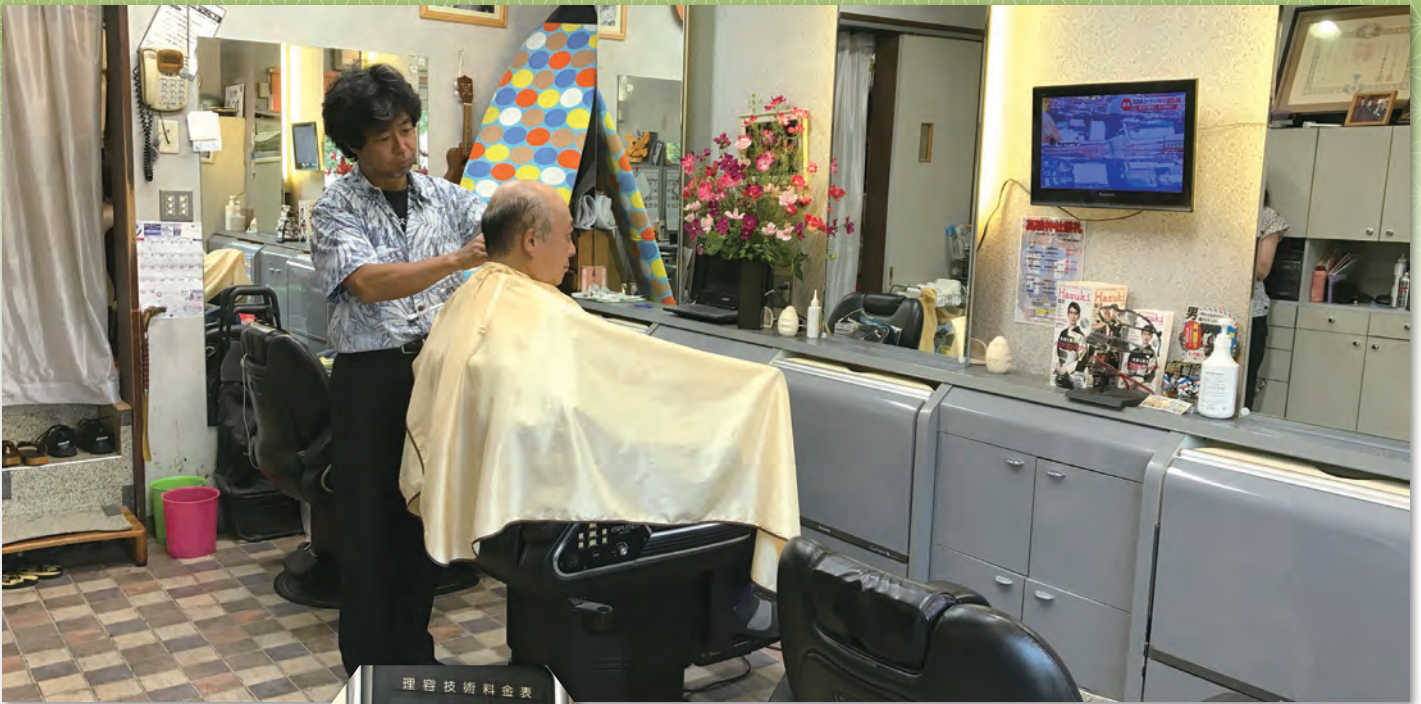
店内には趣味のサーフボードが飾られている