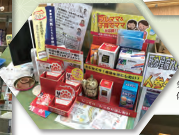
免疫力を高め、 体力を上げ、未病予防を