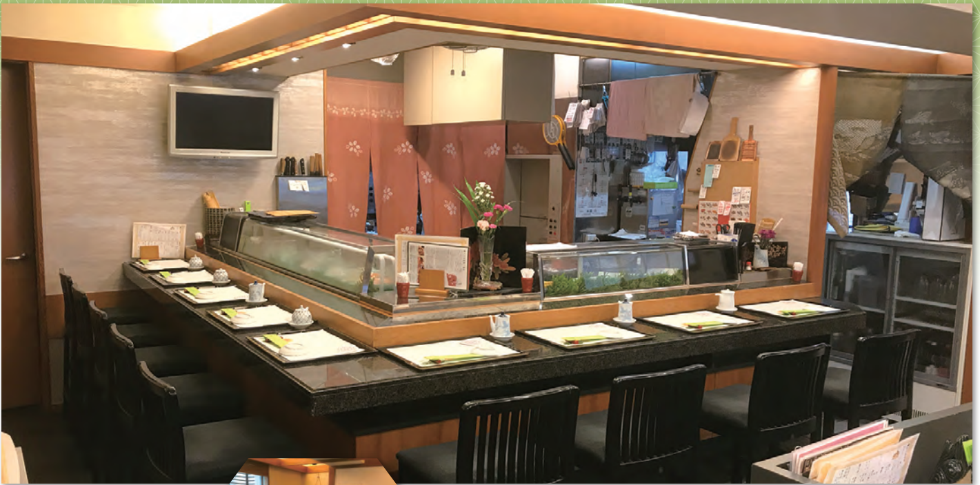
グルメサイトを見て 遠方からくるお客さんも