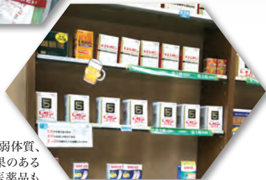
滋養強壯、虚弱体質、 肉体疲労等に効果のある おススメの医薬品も