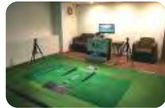
最先端のセンサーシステムで計測と分析を行う