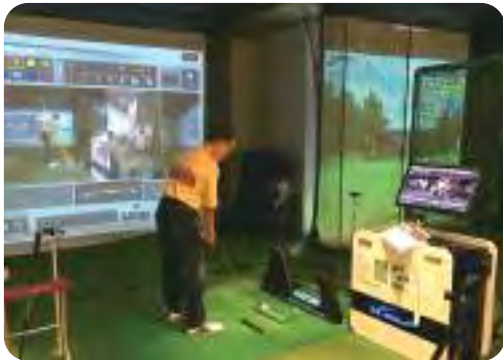
正面・後方からのスイングを確認できる