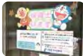
託児サービスは乳幼児からOK (月、火、金、土)