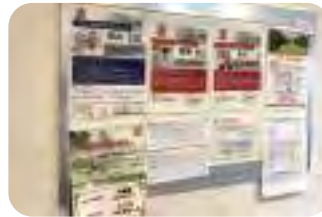
1回15分から1年間まで様々なレッスンコース有