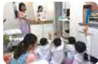
学童期に健康な口腔内を目指し健康の土台を築く