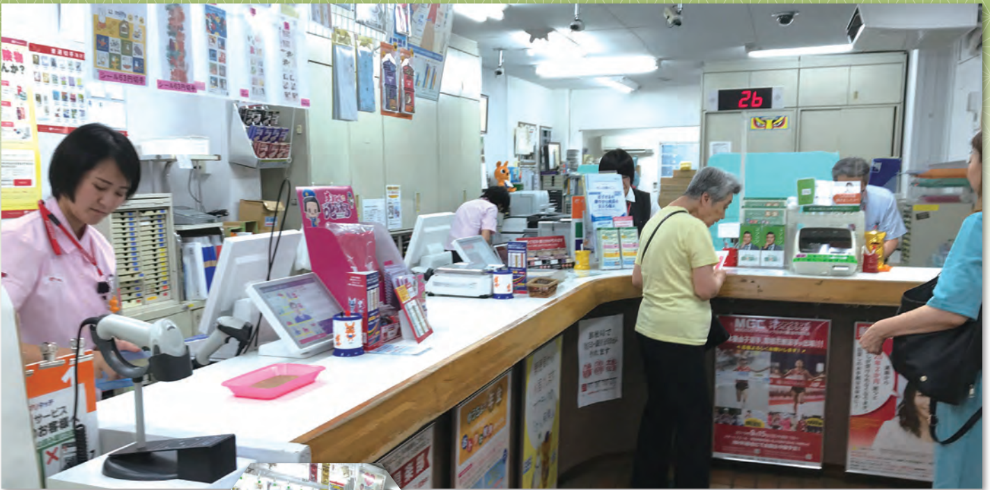
かわいいレターセットや カードも販売