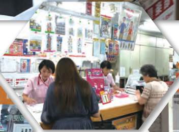
昨年、手紙が見直されていて 「切手女子」が増加中