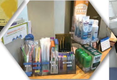
学校校医、母親学級、イベントなどの活動も