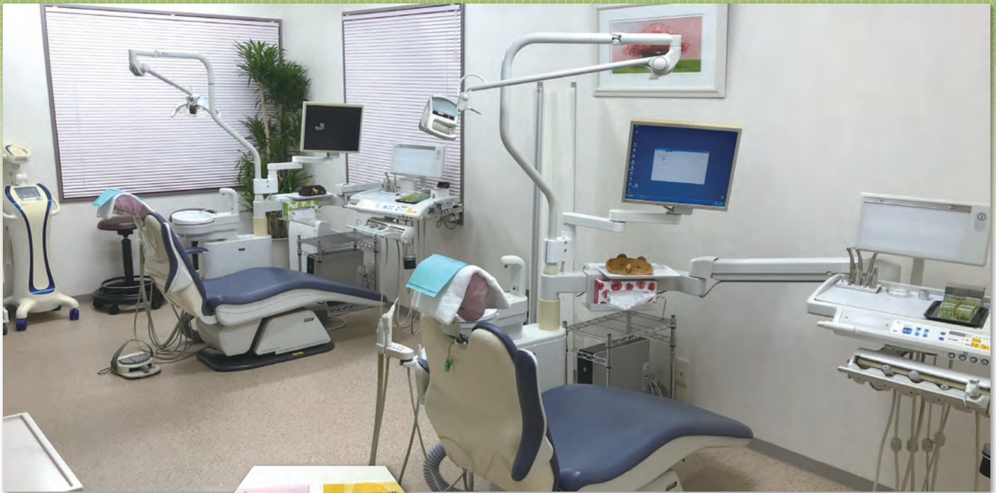
HPのブログで健康寿命の延ばし方を指南