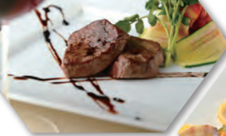
肉は宮崎和牛や伊のウサギ、 仏のホロホロ鳥など