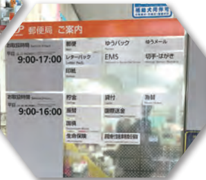
会員サービス 「郵便局倶楽部」には特典が