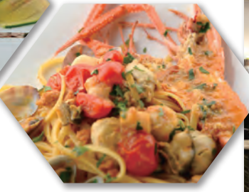
魚は宮崎や沼津の漁港から 直送している