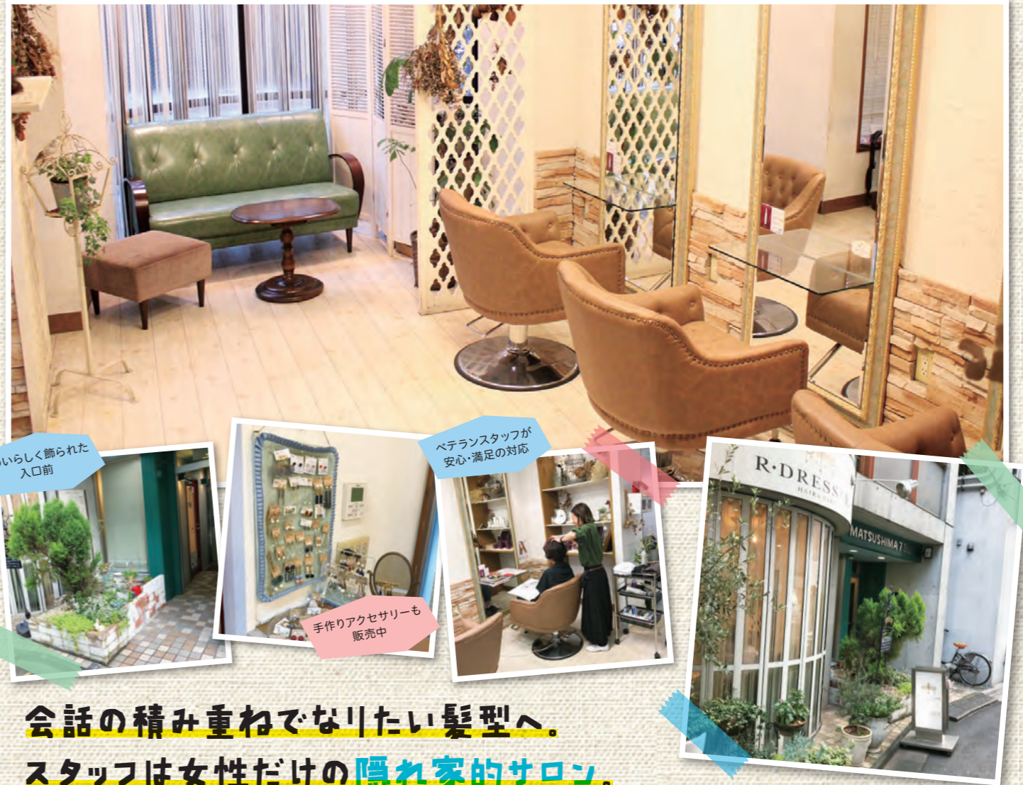
かわいらしく飾られた 入口前