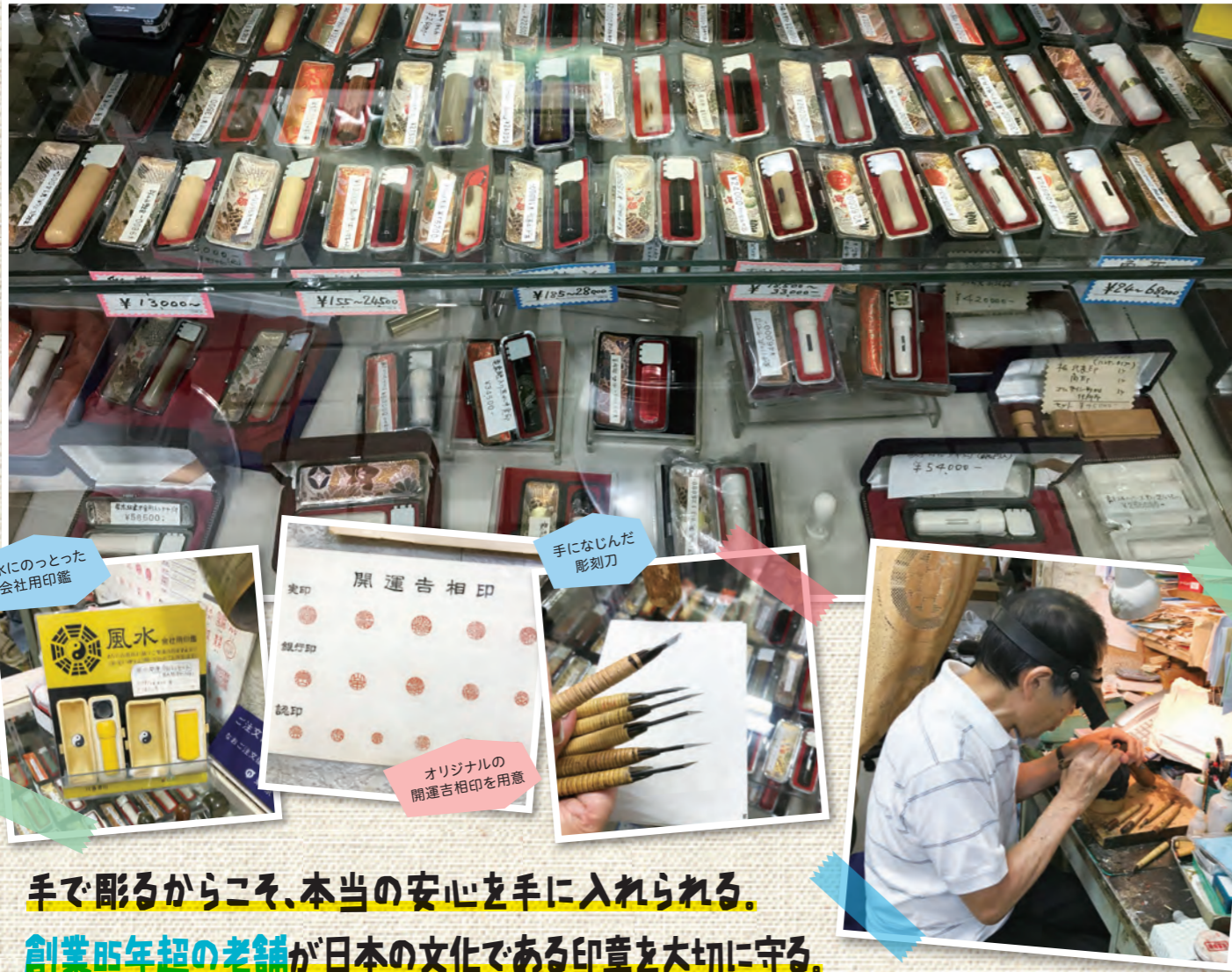
風水にのった会社用印鑑