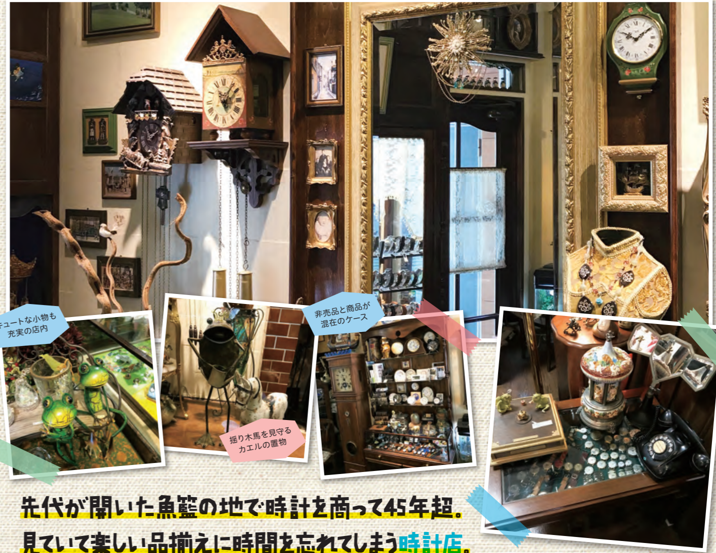
キュートな小物も充実の店内