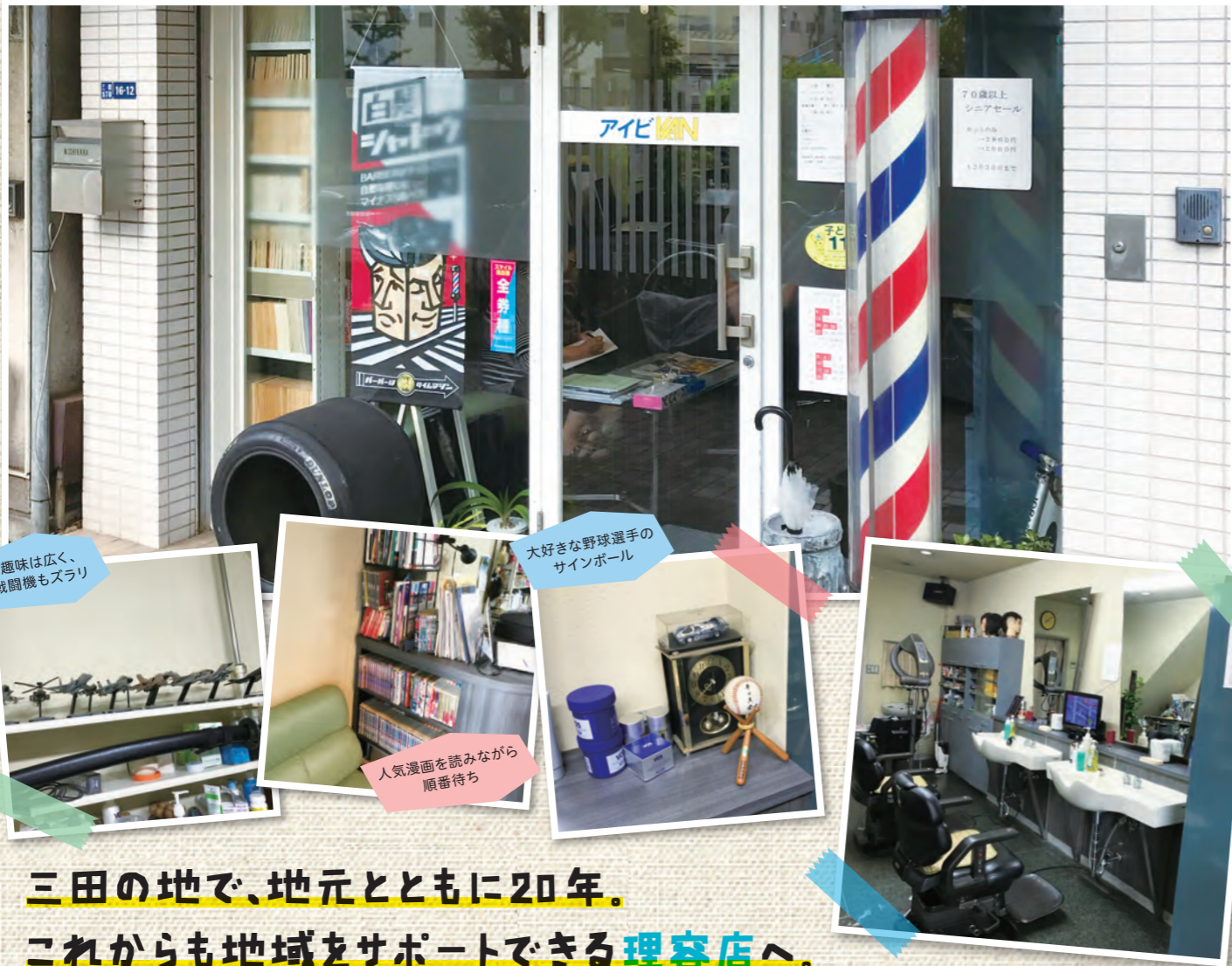
趣味は広く、 戦闘機もスラリ