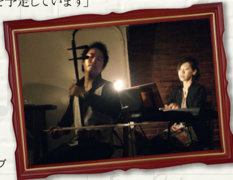
二胡とピアノのライブ

営業時間： （月）～（金）18:00～24:00 （土/日）12:00～14:30 18:00～24:00 定休日 月曜日/祝祭日 住 所： 港区高輪1-5-48 ☎03-3449-4166