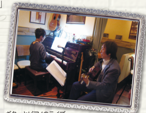
ギターとピアノのライブ

営業時間： （火）～（金）8:00～23:00 （土）11:00～23:00 （日/祝祭日）11:00～22:00 定休日 月曜日 住 所： 港区高輪1-3-17 ☎03-3441-0303