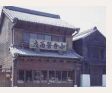
(担当 / 伊関・吉田・明石)

★3 小寺醤油店 建物は昭和8年(1933)に建てられ、<出桁造り>とあって、庇の下の腕木とその上の桁が特徴です。現在の白金で大正期から営業しており、味噌や醤油、酒類を売っていました。【白金5-15】