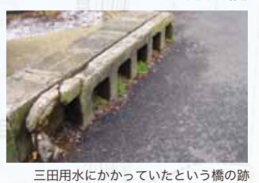
三田用水にかかっていたという橋の跡

協力: 江戸東京たてもの園 小金井市桜町3-7-1(都立小金井公園内) TEL: 042-388-3300 JR中央線武蔵小金井駅または西武新宿線花小金井駅からバス5分