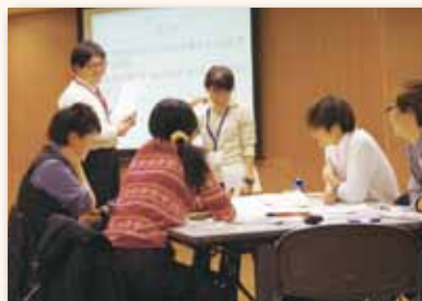
ワークショップでは活発に意見を交換