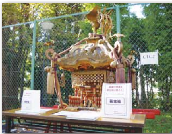
フリーマーケットで展示された神輿

プロジェクト」(以下「神輿プロジェクト」)を新たに立ち上げ、あちこち傷んだ神輿の修理費用を集めようと募金活動も行っています。