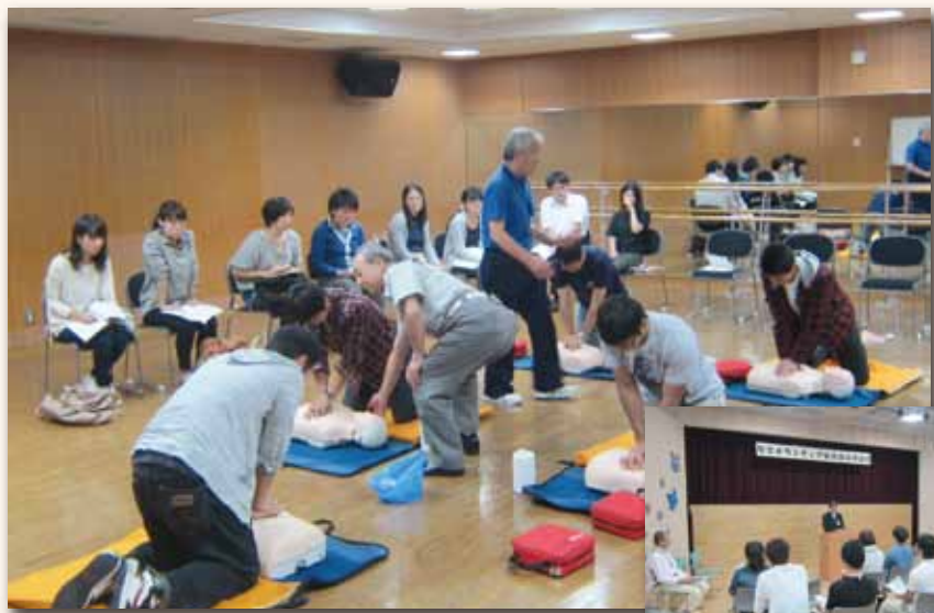
応急救護訓練に汗を流す

いつ襲ってくるかもしれない大災害に備えて、防災力アップを目標に、高輪地区では高輪地区総合支所の地域事業として「地区内大学生防災ボランティア養成講座」を昨年6月から実施しました。これは地区内にある北里大学・東海大学・明治学院大学と高輪地区総合支所が連携し、3大学の大学生を対象に行っています。受講生は、災害時のボランティアに必要な基礎知識や実践的内容等を約1年にわたって習得し、災害時ボランティア活動の核となって活動できることをめざしています。講座は23名の参加で第1回がスタートし、各大学の教授や防災専門家が講師をつとめています。今年2月に全講座が修了し、晴れて養成講座受講生の“地域支援チーム”第1期生が誕生しました。