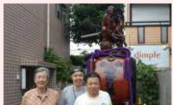
修繕が完了した山車と太鼓