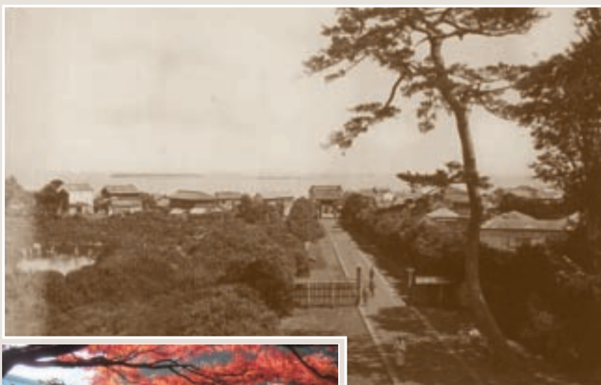
東禅寺山門より見た参道と品川の海 「ファー・イースト」 1873年1月16日号