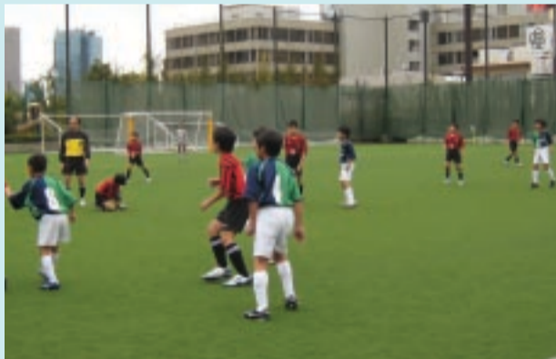
決勝戦 緑のユニフォームが「風の子サッカークラブ」

負けたのでやや気落ちした表情でしたが、しっかりとした口調で答えてくれました。敗因は、相手がやや学年が上の小学生が多かったこと、こちらの決定力不足などをあげていました。彼は、3年の時まで、アメリカにいて、サッカーをやっていたそうで、英語もできるそうです。将来もサッカーを続けて、スポーツ、学業とも両立してやっていきたいとのこと、頼もしい少年でした。