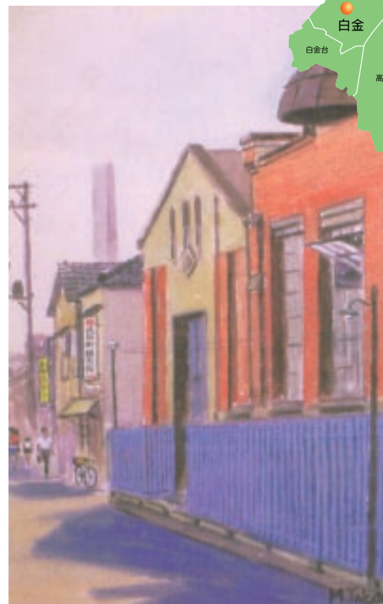
戦後すぐの白金志田町の風景(絵:故 高寺正雄画伯)