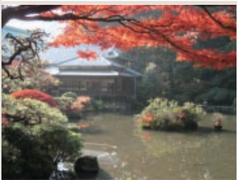
◀現在の東禅寺 (公使館のあつた場所の建物と庭園)