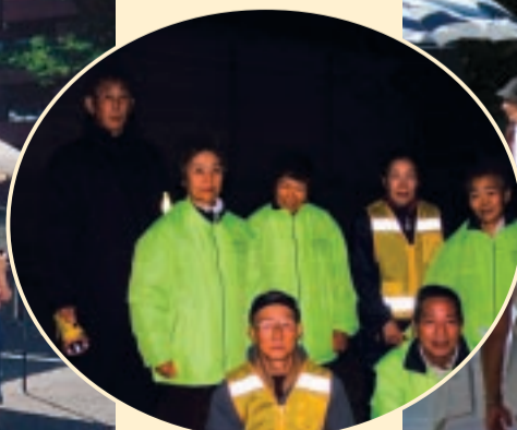
年末のパトロール