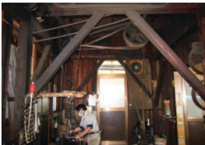
◀伝統的な工法で金属加工をしている工場

白金高輪地区の町工場は、このような素晴らしい職人達の技術や工夫により発展してきました。