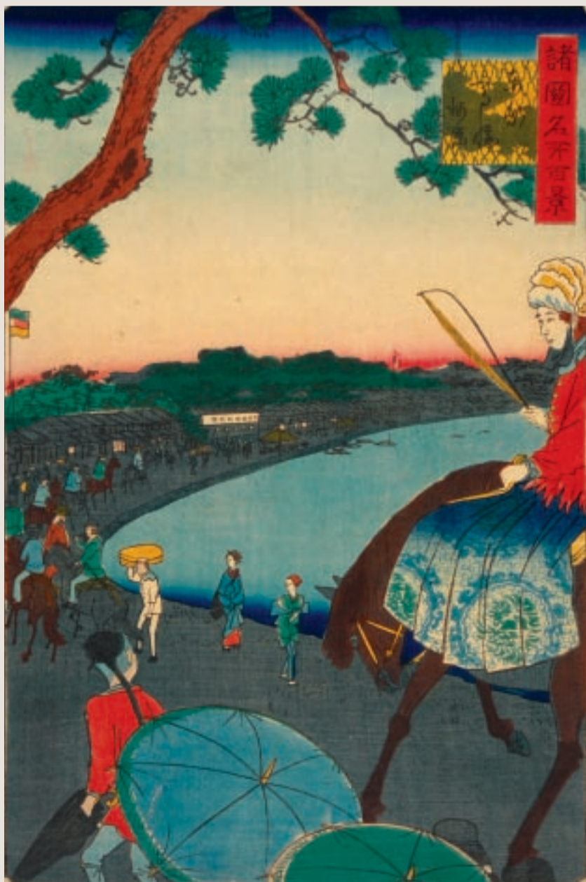
錦絵に描かれた高輪地区の外交官達の行列 「諸国名所百景 東都高輪海岸」(歌川広重(2代)画、港郷土資料館蔵)

公使館として使われた建物があつた位置に、現在も建て替えられた建物がありますが、広い池がある美しい庭園に面しており、素晴らしい眺めであつたと想像されます。