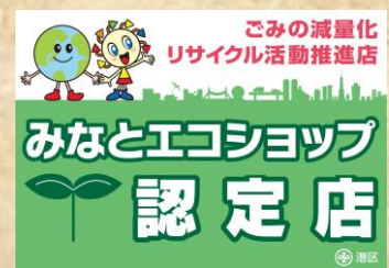
認定ステッカー（イメージ）