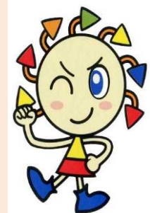
港区リサイクル キャラクター エコル

【問合せ・申込み】 港区 みなとリサイクル清掃事務所 ごみ減量・資源化推進係 〒108-0075 港区港南3-9-59 電話03-3450-8025(代) FAX03-3450-8063